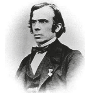
Louis Appia 1818-1898

Société Henry Dunant Société Louis Appia Genève et Dybbøl – Düppel Deuxième édition revue et corrigée 2 septembre 2024