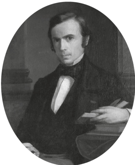
Louis Appia 1818-1898