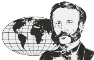
Henry Dunant 1828-1910