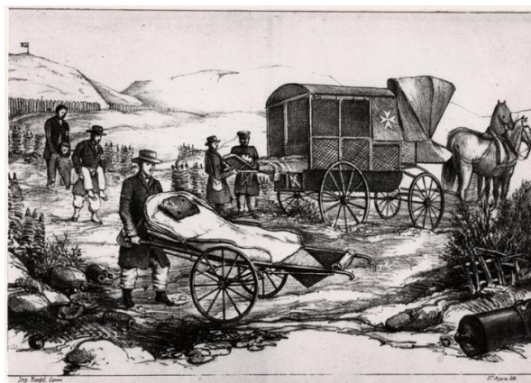
Disegno di Louis Appia, proposta per una barella su ruote