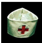
Musée international de la Croix-Rouge et du Croissant-Rouge à Genève.