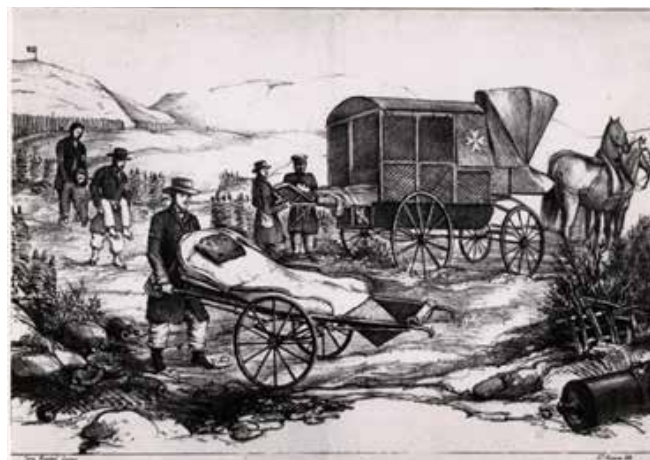
Dessin de Louis Appia, proposition de brancard sur roues