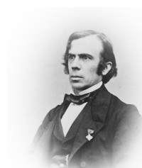
Louis Appia 1818 - 1898