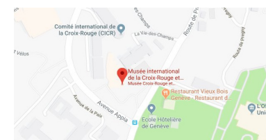
Musée international - avenue de la Paix 17