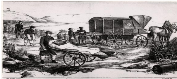
Dessin de Louis Appia, proposition de brancard sur roues