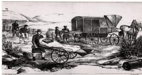
Dessin de Louis Appia, proposition de brancard sur roues