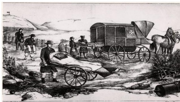
Dessin de Louis Appia, proposition de brancard sur roues